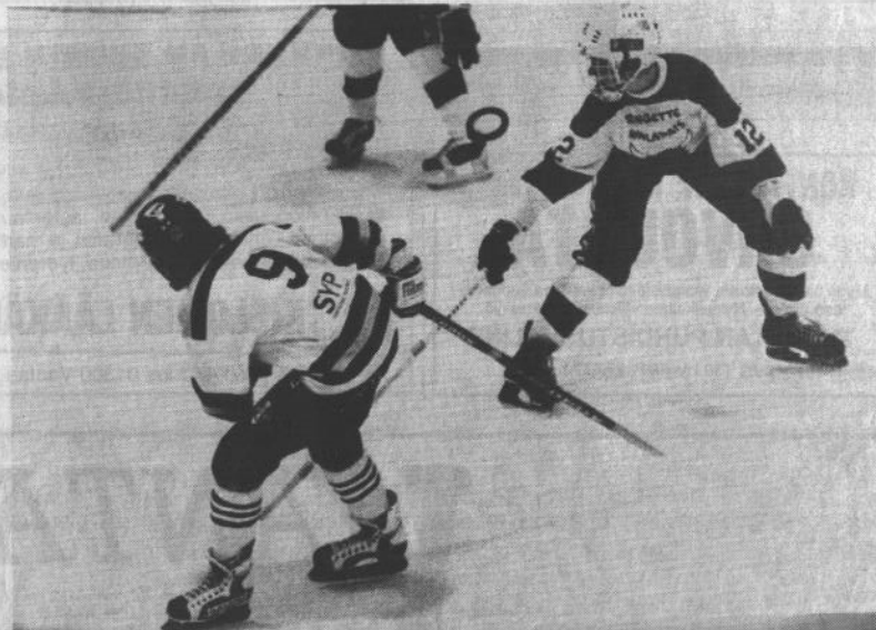
Järjestäjäseura Ringette Walapais jätettiin turnauksessa neljänneksi.

Ringette on työlle kehitetty jääpeli. Sitä on pelattu Kanadassa jo yli 20 vuotta. Suomessa laji on harrastettu vuodesta 1978. Suomen Ringettelitto perustettiin vuonna 1983. Valtakunnallinen liikuntajärjestö ja SVUL:n jäsen liitosta tuli vuonna 1985.